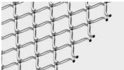
SINUSFÖRMIG PROFILIERTE STAHLROHRE mit einer Überdeckungshöhe von 55 mm