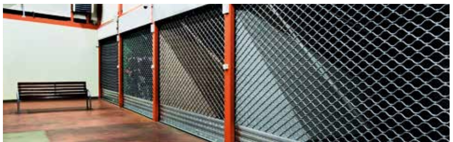
SINUSFÖRMIGES ROLLGITTER R2 SSG