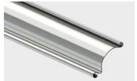
EINWANDIGES STAHLPROFIL mit einer Überdeckungshöhe von 91 mm