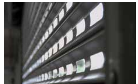
ROLLGITTER R2 AMP