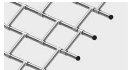
MIT STEGTEILEN VERBUNDENE GERADE STAHLROHRE mit einer Überdeckungshöhe von 120 mm