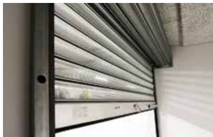
PERFORIERTES GITTER R2 SPG