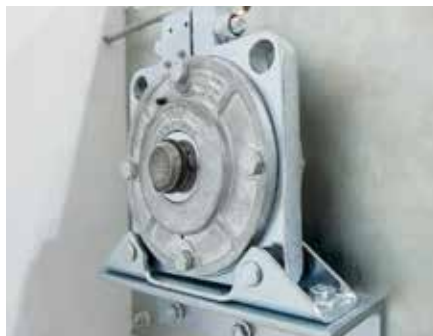
TRÄGHEITSBREMSE kommt in Rolltoren und -gittern mit Rohrantrieb zum Einsatz