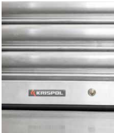
RIEGELSCHLOSS in der unteren Leiste