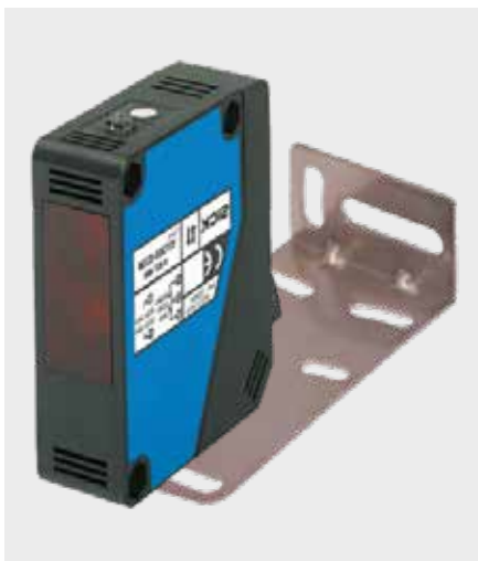
LICHTSCHRANKE Einweg-Ausführung IP65