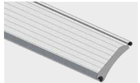
WÄRMEGEDÄMMTES STAHLPROFIL mit einer Überdeckungshöhe von 95 mm