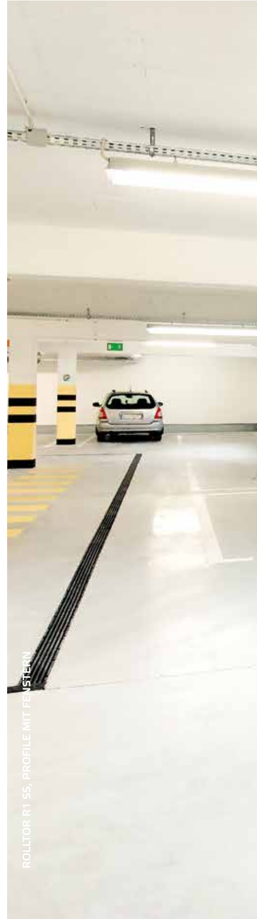
ROLLTOR R1 55, PROFILE MIT FENSTERN