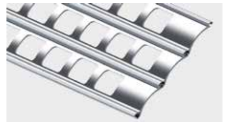
GESTANZTES ALUMINIUMPROFIL mit einer Überdeckungshöhe von 60 bzw. 85 mm