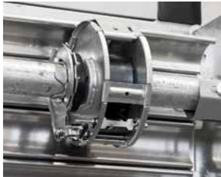
SICHERUNG beim Federbruch