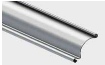
EINWANDIGES ALUMINIUMPROFIL mit einer Überdeckungshöhe von 91 mm