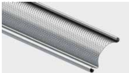
PERFORIERTES ALUMINIUM- ODER STAHLPROFIL mit einer Überdeckungshöhe von 91 mm

Die Optik und der Aufbau von Rollgittern hängt von der jeweiligen Stelle, an der sie montiert werden, sowie Funktionen, die sie zu erfüllen haben, ab. In den Räumen, die nicht nur sicher geschützt, sondern auch hervorgehoben sein müssen, bewähren sich Gitter aus geraden oder sinusförmig gebogenen Stahlrohren. Zu modernen Innenräumen, die hohe Anforderungen an die Belüftung stellen, passen Aluminiumgitter mit Maschen in rechteckiger Form perfekt. Gitter aus perforierten Stahl- und Aluminiumprofilen gewährleisten gleichzeitig optischen Schutz und Luftdurchlässigkeit von 28%. Aluminiumgitter und Stahlgitter, die aus perforierten Profilen gebaut werden, können in einer von 200 Farben der RAL-Palette lackiert werden.