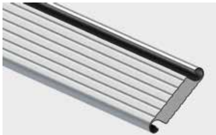
WÄRMEGEDÄMMTES ALUMINIUMPROFIL mit einer Überdeckungshöhe von 100 mm

Industrietore haben sehr unterschiedliche Verwendungszwecke. Wir stellen sie genau nach den gewünschten Maßen her und wenden dabei Lösungen an, mit denen die Anlagen an verschiedene Aufgaben und Einbaugegebenheiten angepasst werden können. Es sind u. a. Profile mit Fenstern und Belüftungsprofilen sowie perforierte Profile bei nicht wärmegeämmten Toren. Ein interessanter Vorschlag ist das sog. „Tor mit Tätowierung“, d.h. mit individuell projektiierter Perforation des Rolltorpanzers, dessen Muster z.B. an das im jeweiligen Objekt ausgeübte Gewerbe anknüpft.