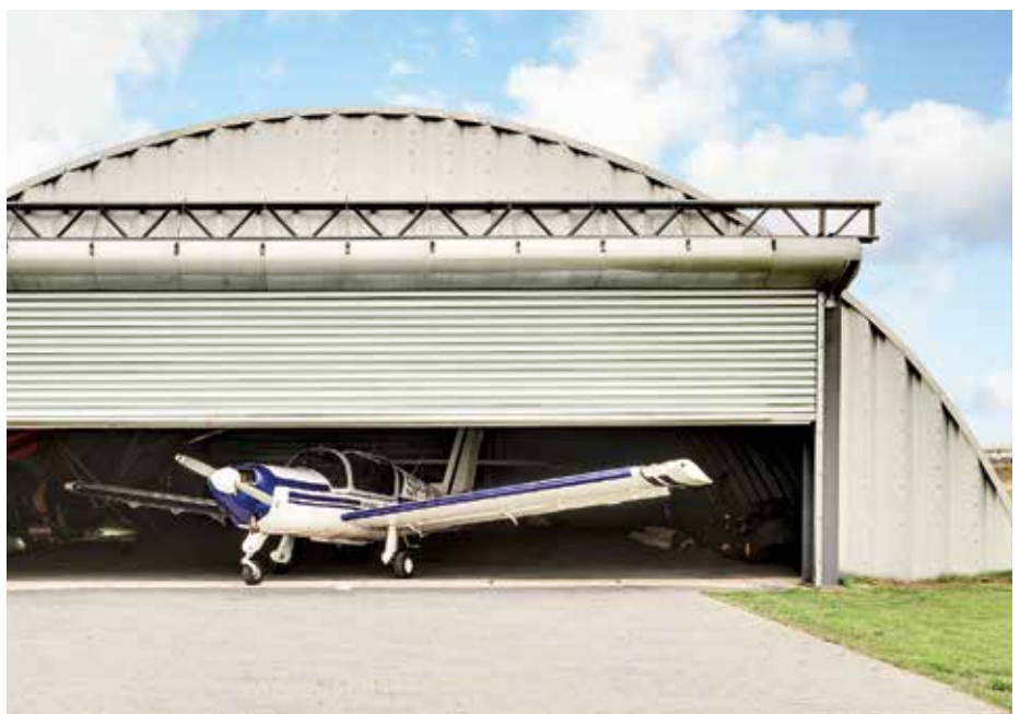
TOR R1 SSP AUS EINWANDIGEN STAHLPROFILEN

Aufgrund seiner Robustheit ermöglicht es die Schaffung von sehr breiten Konstruktionen